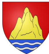
Commune de Steinsoultz