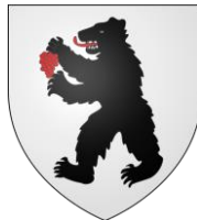
Commune de Wittersdorf