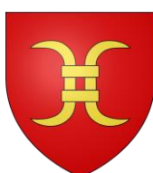
Commune de Schwoben